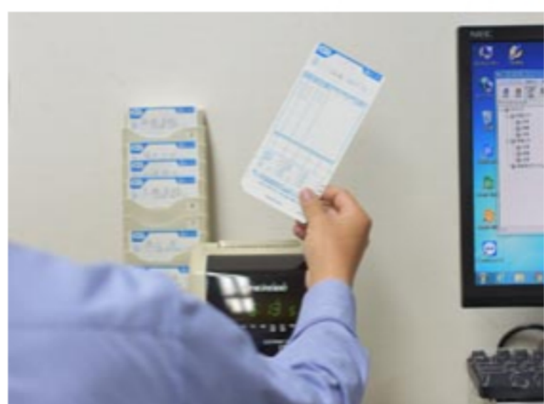
残業時間目標の設定