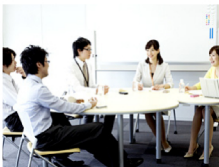
意見の言いやすい環境