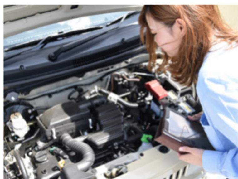
男女関係ないチャレンジ機会