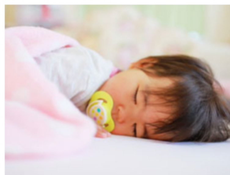
産休・育休を取りやすい雰囲気

“自動車業界は男社会の時代”は終わりました。今は女性が活躍できる会社でなければ生き残ることが出来ないとエフエルシーは考えています。エフエルシーでは、男女問わず同じチャレンジの機会を与えていますので、営業スタッフもサービススタッフも活躍している先輩が働いています。